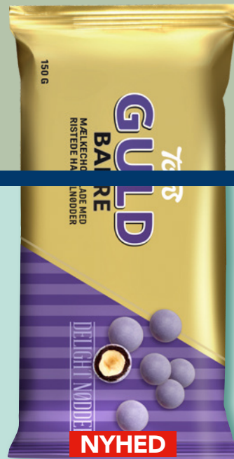
Plakat + Topskilt i separate filer